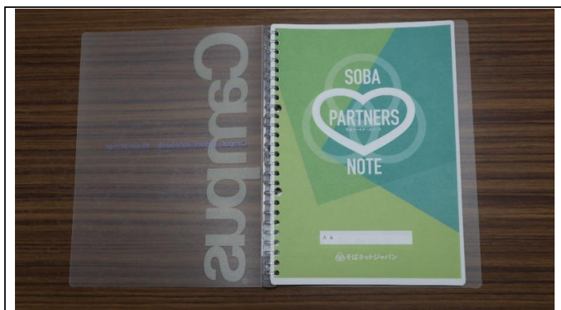
1 表紙 バインダーは「コクヨ半透明」品番ル-P733T