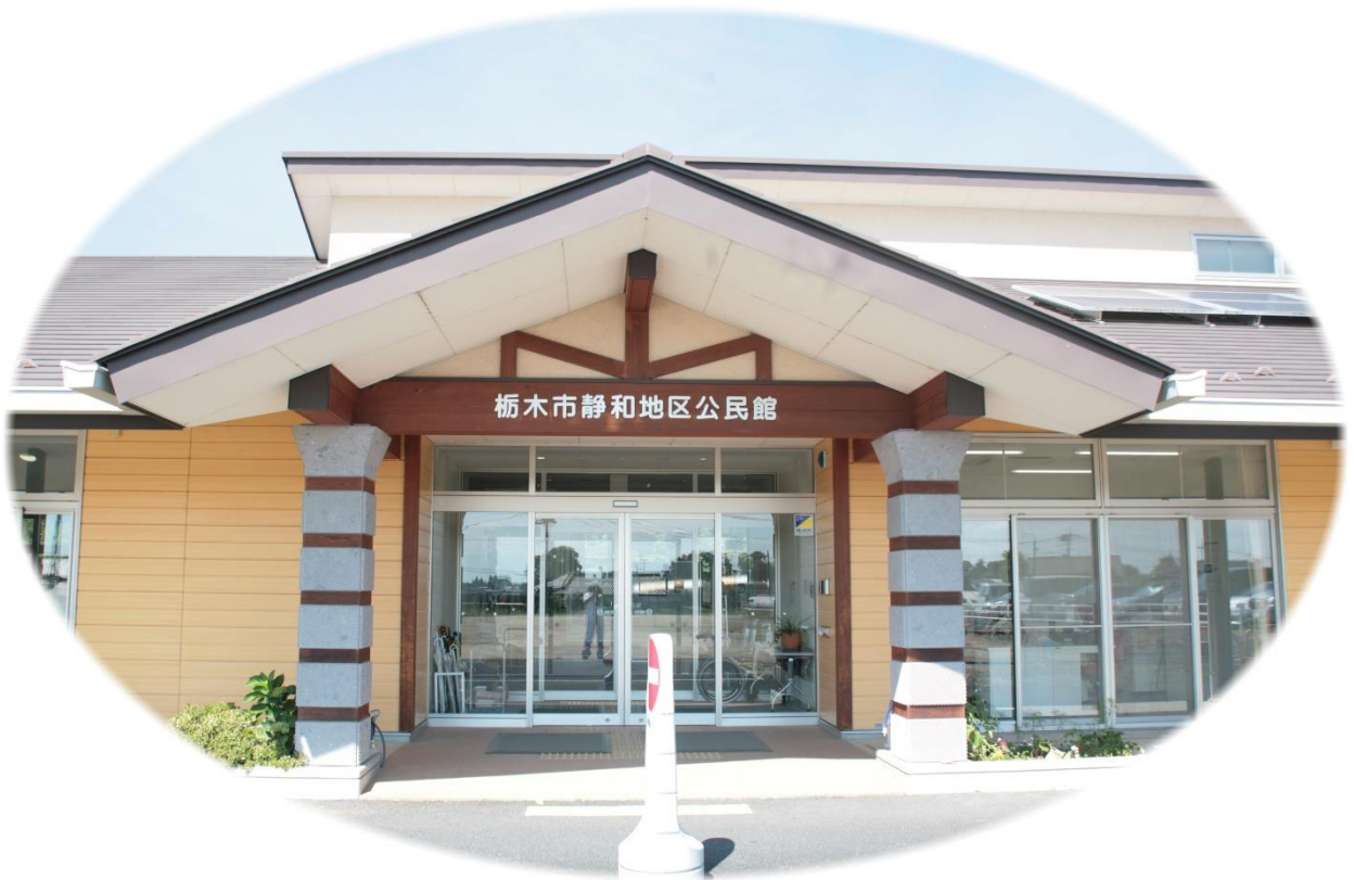
写真 栃木市岩舟町静和地区公民館

静和地区公民館は、栃木市岩舟地域の東部に位置し南部を国道50号、中央部に東部日光線が通過する静和駅があり商店街・住宅街がひろがっております。