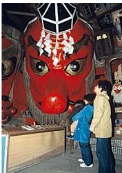
(日本一の大きさを誇る天狗面)