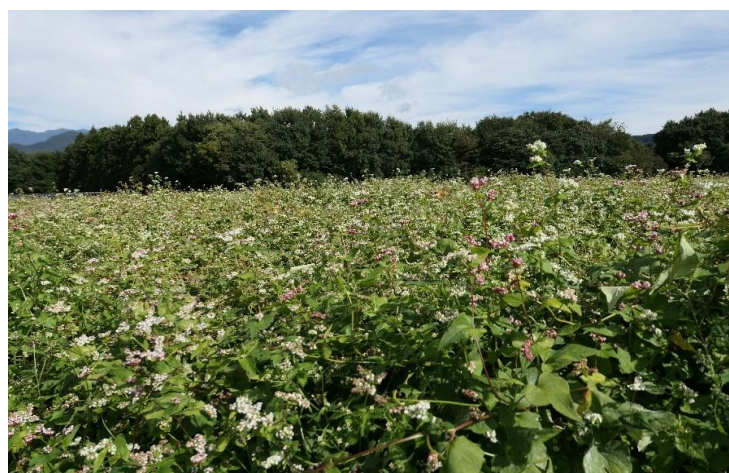
在来種の保存は厳しい