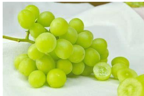
(シャインマスカット)

世界一大きく、甘さ抜群の藤稔、そのまま皮ごと食べられる、今一番人気のシャインマスカットを一房ずつ頂いて、とても満足でした。